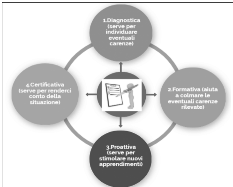
FIG. 2. Momenti di valutazione del livello di competenze

Partendo dal presupposto che la valutazione ha sempre un carattere di soggettività e non può essere formulata in modo totalmente e assolutamente oggettivo – in quanto è sempre legata a una particolare situazione e a una particolare persona che la effettua – bisognerà concentrarsi sull'utilizzo di metodi che possano ridurre al minimo tale caratteristica. Un'idea potrà essere quella di privilegiare l'osservazione partecipata di tutto il team dei docenti, per esempio creando