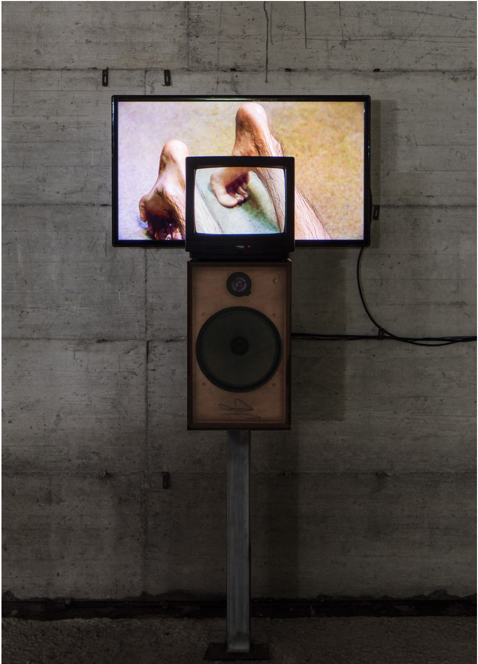
Fig. 2. Naked , 2014, Cité Internationale des Arts, Paris. Installazione audio-visuale: 1 LED screen 40inch, 1 MIVAR television 15inch, 1 speaker, 2 BrightSign synchronizers, 1 amplificatore, 1 mixer.