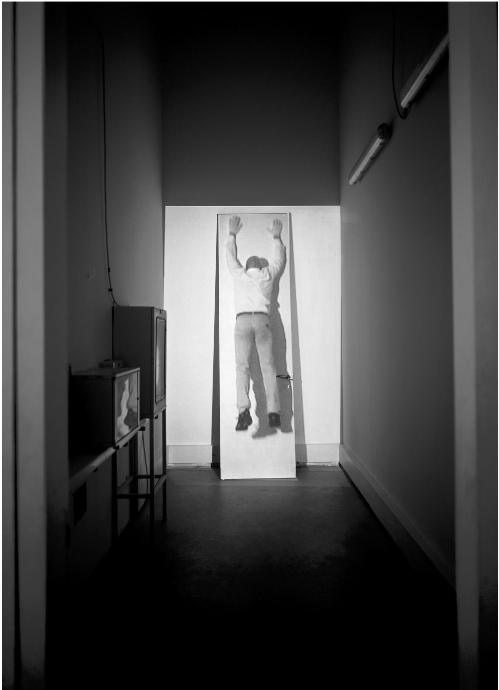
Fig. 8. FATICA n.18 , 2002, Fondazione Sandretto Re Rebaudengo, Torino. Installazione site-specific audio-visuale: 1 video proiettore, 1 porta 60x300cm, 1 BrightSign, 1 sound mixer, 1 amplificatore, 2 speakers, 1 subwoofer.