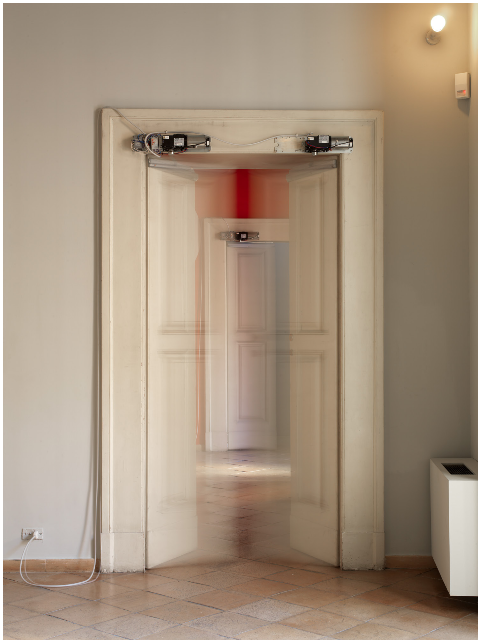
Fig. 3. Zero, 2009, Pescara. Installazione site-specific mix-media: 40 automatismi temporizzati, porte, finestre.