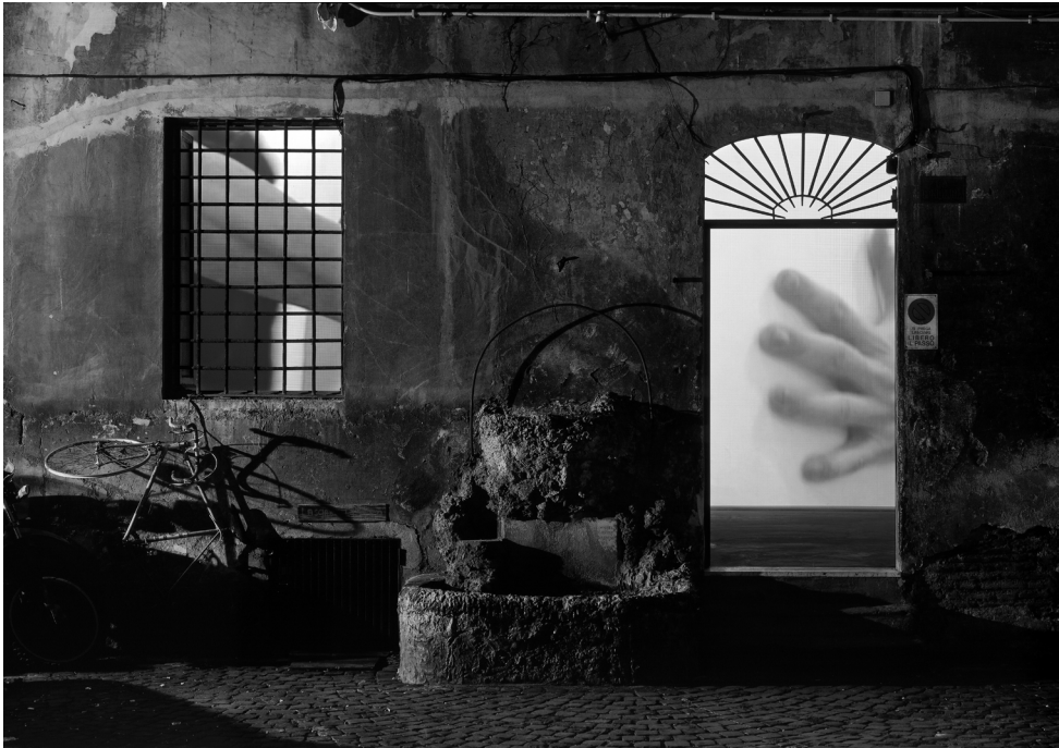
Fig. 9. FATICA n.17 , 2002, Magazzino Gallery, Roma. Installazione site-specific audio-visuale: 2 video proiettori, 2 BrightSign synchronizer, 1 sound mixer, 4 speakers.