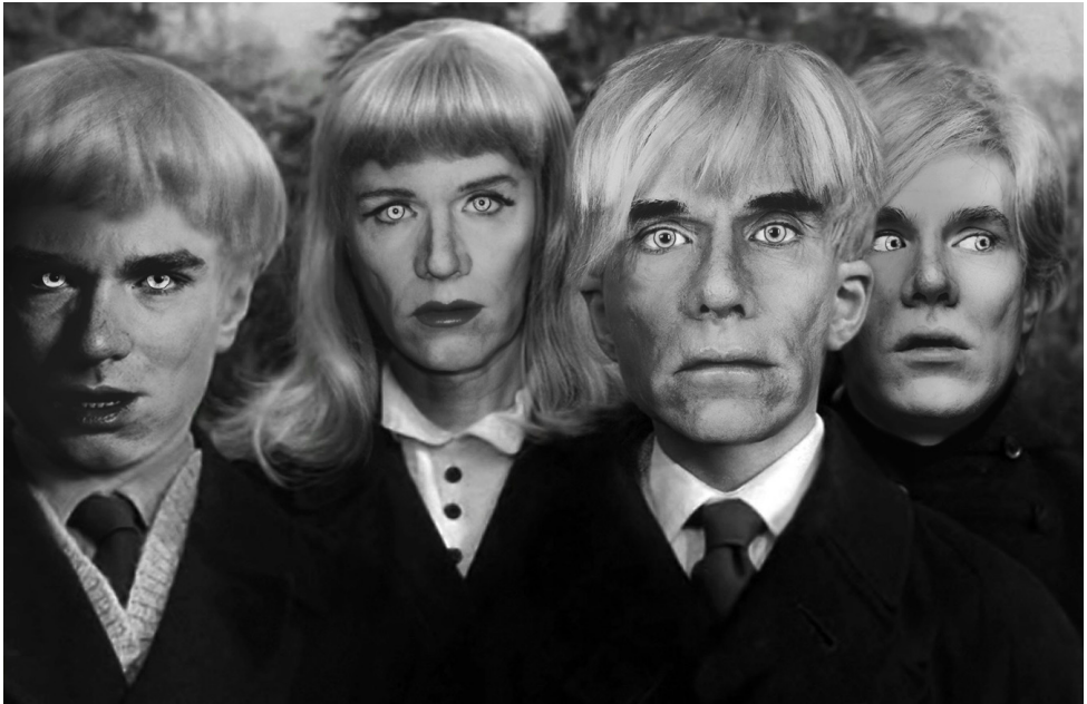
Fig. 10. DAMNED, 2016, Fotomontaggio digitale.