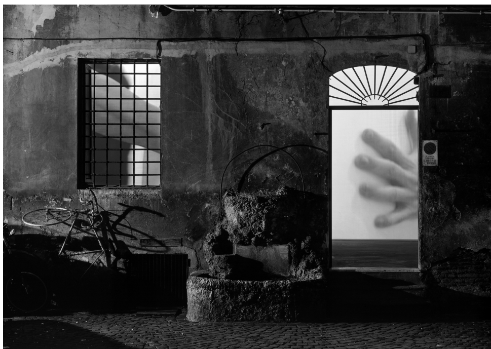
Fig. 9. FATICA n.17 , 2002, Magazzino Gallery, Roma. Installazione site-specific audio-visuale: 2 video proiettori, 2 BrightSign synchronizer, 1 sound mixer, 4 speakers.