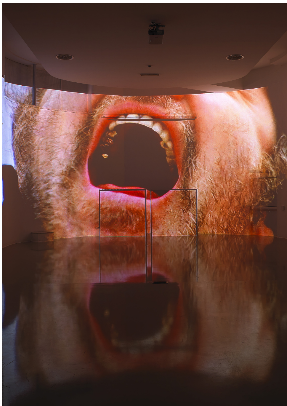
Fig. 1. Cinema Rianimato n.3 , 2012, Exgil, Roma. Installazione audio-visuale: 1 videoproiettore, 1 dvd player, 1 sound mixer, 2 amplificatori, 4 speakers, 4 subwoofers, 2 schermi.