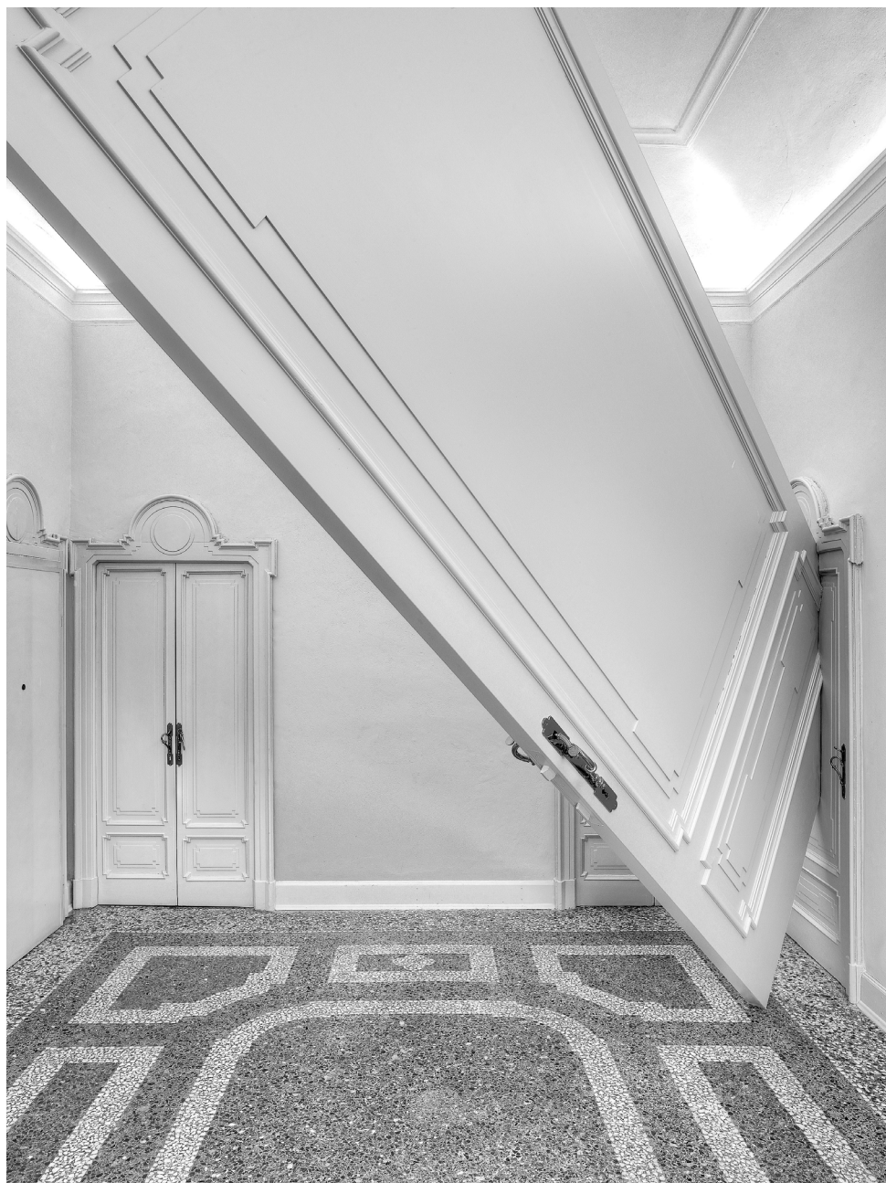
Fig. 7. INTERAZIONI D'URTO n.1 , 2016, Collezione privata, Milano. Installazione scultorea, legno e bronzo.