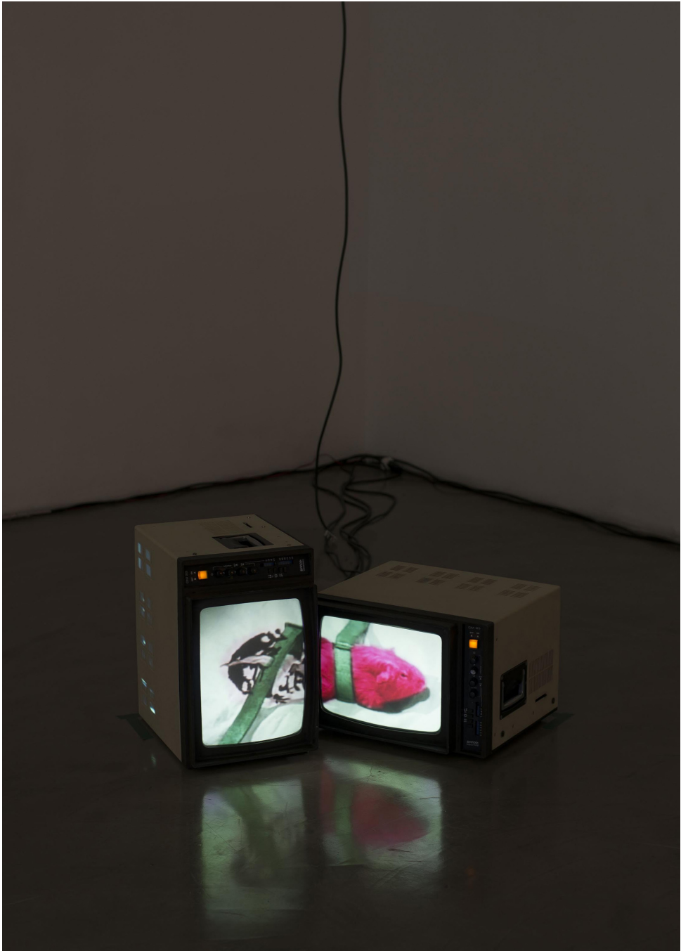
Fig. 5. Blast , 2013, Magazzino Gallery, Roma. Installazione audio-visuale: 2 videoproiettori, 2 dvd player, 4 monitors Barco CM33, 2 mixer, 1 electronic board Borghesani, 1 amplificatore, 2 speakers, 1 subwoofer.