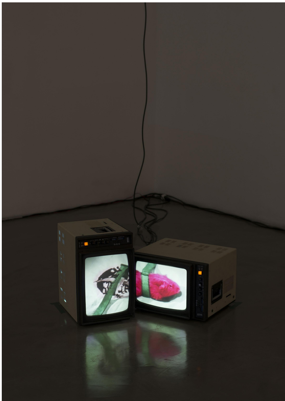
Fig. 5. Blast , 2013, Magazzino Gallery, Roma. Installazione audio-visuale: 2 videoproiettori, 2 dvd player, 4 monitors Barco CM33, 2 mixer, 1 electronic board Borghesani, 1 amplificatore, 2 speakers, 1 subwoofer.