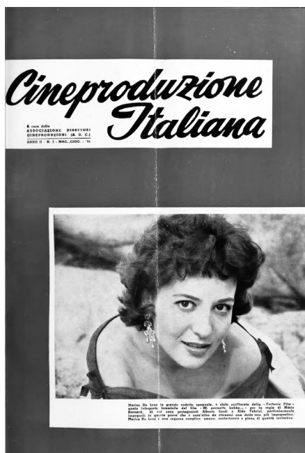
Copertina di Cineproduzione Italiana nel design usato nelle prime due annualità Fig. 7. (1955-1956).