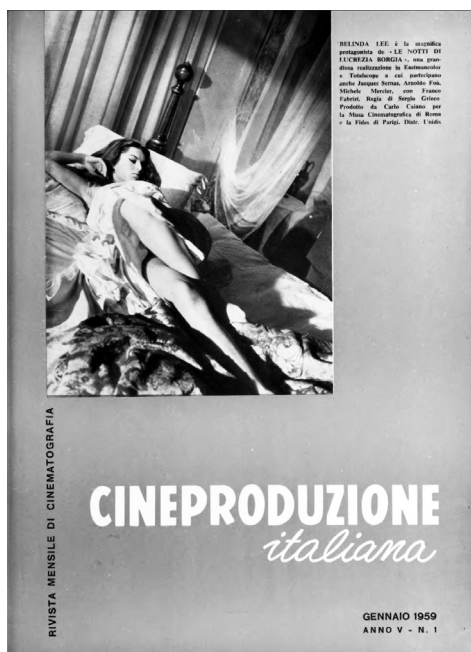
Fig. 8. Copertina di Cineproduzione Italiana . Rivista Mensile di Cinematografia nel design usato nel 1958 e 1959.

Il recupero del design delle copertine dei rotocalchi puntellati dai volti e dai corpi di attori e attrici, non deve però ingannare sulla presa di posizione che anche la rivista in esame esprime in merito al dibattito sull'eccessivo potere contrattuale del settore divistico. In questo periodo, infatti, tanto le riviste specializzate quanto quelle di critica convergono in un'aperta discussione relativamente «al rinnovamento del panorama attoriale postneorealista e all'individuazione di politiche di riduzione dei costi di produzione come antidoto alla crisi» (Di Chiara e Noto 2019, 502) 2 .