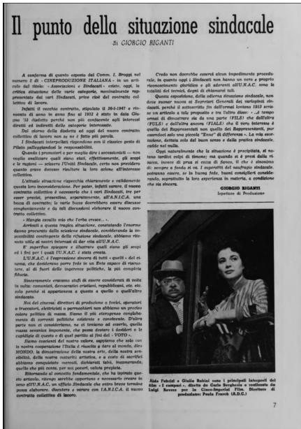
Fig. 4. Articolo di Giorgio Riganti, Cineprotezione Italiana , giugno 1955.

all'azione contrattuale per la stipulazione dei patti di lavoro. La convenzione prevede inoltre una stretta e permanente mutua assistenza tra le parti sia sul piano sindacale che su quello organizzativo. Dal canto suo la Fuls si impegna a svolgere tutta l'azione necessaria per potenziare l'Unac, favorirla e sostenerla nel suo specifico compito di organismo di tutela giuridico-morale dei tecnici della cineproduzione. È sul versante giuridico che i direttori di produzione, a cui viene negata la qualifica di dirigenti d'azienda, si scontreranno con il sindacato nel 1957, tentando come associazione di perimetrare la figura professionale attraverso due proposte: la richiesta del diploma al Csc e la creazione del Sindacato Nazionale Direttori Cineproduzione, obiettivo che si concretizza su questa spinta: