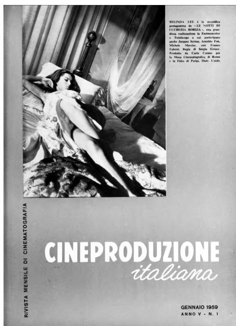
Fig. 8. Copertina di Cineproduzione Italiana . Rivista Mensile di Cinematografia nel design usato nel 1958 e 1959.

Il recupero del design delle copertine dei rotocalchi puntellati dai volti e dai corpi di attori e attrici, non deve però ingannare sulla presa di posizione che anche la rivista in esame esprime in merito al dibattito sull'eccessivo potere contrattuale del settore divistico. In questo periodo, infatti, tanto le riviste specializzate quanto quelle di critica convergono in un'aperta discussione relativamente «al rinnovamento del panorama attoriale postneorealista e all'individuazione di politiche di riduzione dei costi di produzione come antidoto alla crisi» (Di Chiara e Noto 2019, 502) 2 .